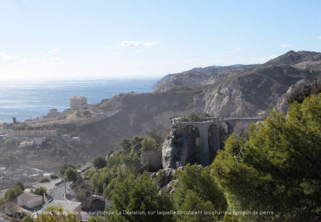
A droite, la rotonde qui surplombe La Déviation, sur laquelle circulaient les chariots remplis de pierre