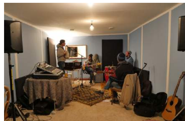
__Le studio de musique