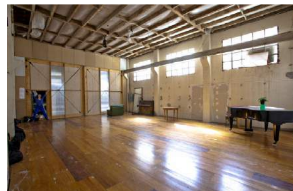
__Le studio de danse